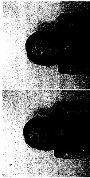
Abb. 5: Stimmungsinduktion bei der Fragebogenbearbeitung Der Stift ist entweder zwischen die Lippen (negative Stimmung) oder zwischen den Schneidezähnen (positive Stimmung)

Insgesamt nahmen 109 Studierende an den Universitäten Salzburg und Heidelberg im Rahmen von zwei Vorlesungen teil (86 Frauen und 23 Männer).